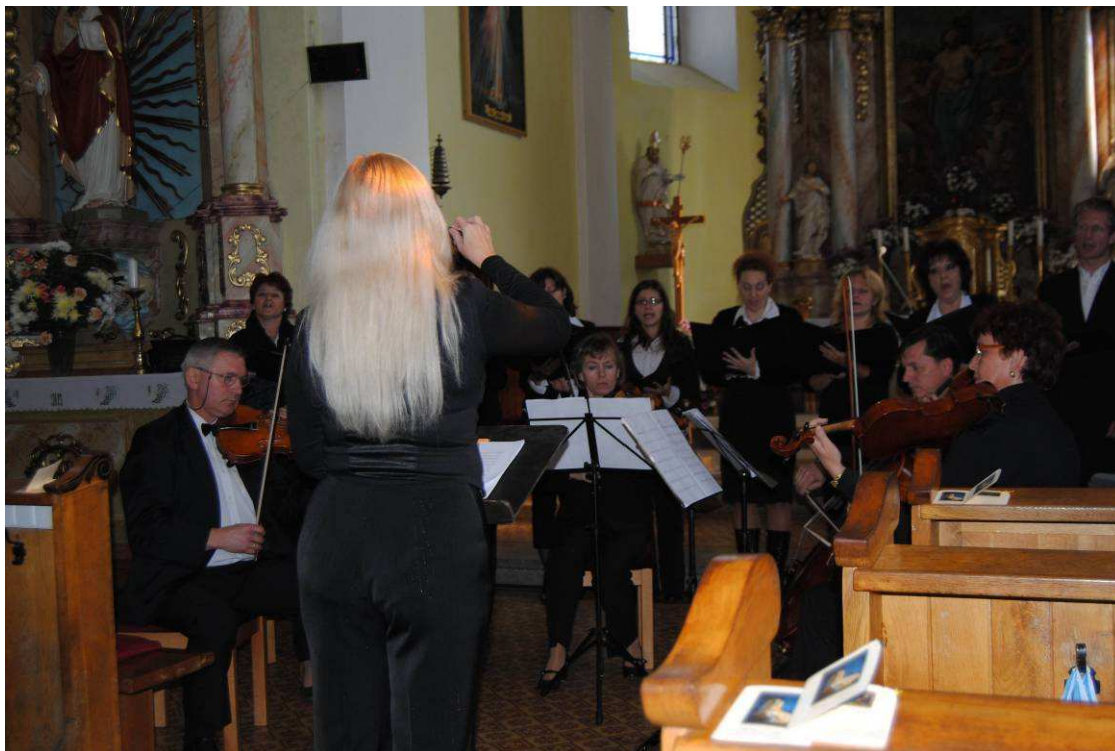
4. Missa Čadca