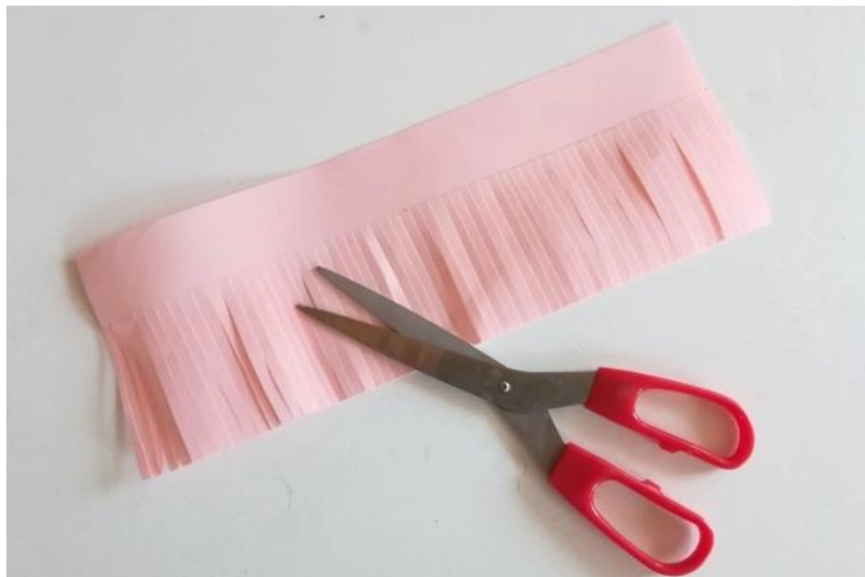
Papier si nastriháme.